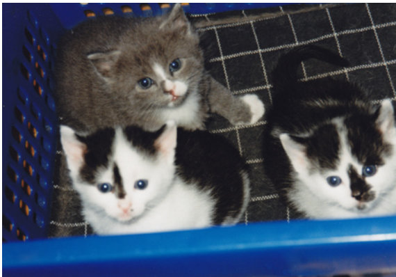
Baasje en vrouwtje smelten...

eenmaal open blauwe oogjes, na tien dagen, begonnen ze met de eerste komieke pogingen om uit de kist te klimmen. Natuurlijk zetten we ze er al weleens naast, maar daar werd Lotte weer erg onrustig van. Met haar 10 maandjes al een echt zorgzaam moedertje. Als de kelderkast open stond betrapten we haar een aantal maal met een kitten te gaan slepen. Ook weer hilarisch, want we zagen het soms pas bij het tweede kitten. En als je weet hoe vol onze kelderkast is, om er daar helemaal achteraan één uit te vissen... Maar goed, de kelderkast daarna dus ook weer opnieuw logisch heringedeeld.