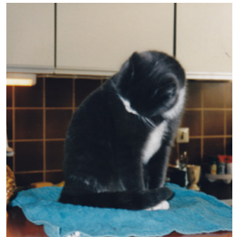
Op haar gemak wassend.

Oh wat een drama. Oppassen haar daar niet op die plakkerige plek te aaien, want allemaal zwaar chemisch.