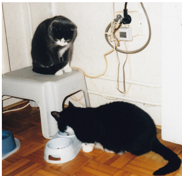
Lotte kon niet bij het voer.

Met een jaartje of drie vermagerde Lotte en togen we steeds opnieuw naar de dierenarts. Geen sinecure voor haar. Ernstig boos en uit haar ritme gehaald. Alleen al jacht maken op haar om in het reismandje getild te worden was een crime, een tijgerjacht waardig. Dit deed ik dus met moed, beleid en trouw. Haar krabben negerend. Sowieso was die lieve, aardige, bescheiden, soms angstige poes, een leeuwijn bij de dierenarts. De assistentes gebruikten zelfs superzware leren handschoenen bij haar. Steeds opnieuw bekloppen, bevoelen, luisteren, bloed controleren: kerngezond zei de dierenarts elke keer.