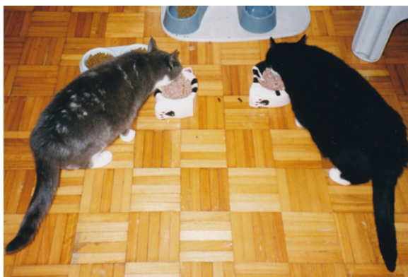
Maar nu wel...met haar sneeuwvlokjesvacht.

Om de draad weer even op te pakken, bij waar ik was gebleven. We snapten er niets van maar observeerden haar goed. En ja de boosdoeners betrapt: Mara en Minet hadden als moeder en dochter een bondje gesloten om haar van het eten af te houden. Wij ook niet voor een kleintje vervaard, de bakjes uit elkaar gezet en ziedaar ze werd op termijn weer haar mooie, iets vierkante, zelf. Helemaal voor niets die dierenartsbezoekjes.