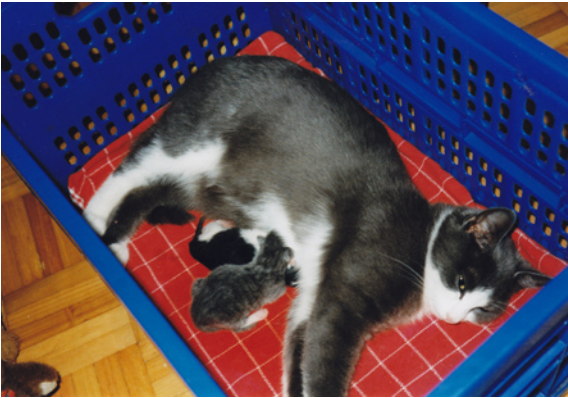
En waar is dat derde kitten nu?

Op de 21ste mei 1998: Hemelvaartsdag - onze ontmoetingsdag in 1989 - miauwde ze vroeg achter ons bed en sprong naar zolder. De boodschap was bij mij niet helemaal doorgekomen, maar toen ze weer beneden zich raar in mijn regenjas aan de kapstok kronkelde, kwam de boodschap over. Alle hens aan dek: Lotje gaat bevallen. Met zachte hand probeerde ik haar in het kratje te krijgen. De dierenarts had immers gemaand dat we er helemaal bij moesten blijven. Zij zocht echter de duisternis in de stof die onder de bank hing. Niet gedraald en de stof kapot geknipt, een plasje bloed was al zichtbaar. En ze beviel van haar eerste, dachten we. Op de grond onder de bank. Met fluwelen handen heb ik de navelstreng, conform de boekjes, afgeknoopt met garen en doorgeknipt. En numero uno na de likbeurten van Lot zachtjes in de krat gelegd, ondertussen haar lokkend ook te komen. Haar moederinstincten waren sterker dan de behoefte aan duisternis. Uiteraard een normaal instinct, maar mocht momenteel door haar jeugd niet. Opnieuw zag ik na een kwartiertje weeën, prachtig die natuur. Numero duo werd geboren. Na de grijs-witte - een katertje bleek achteraf - kwam er een zwart-witte, een poesje als ik me niet vergis. Prachtig