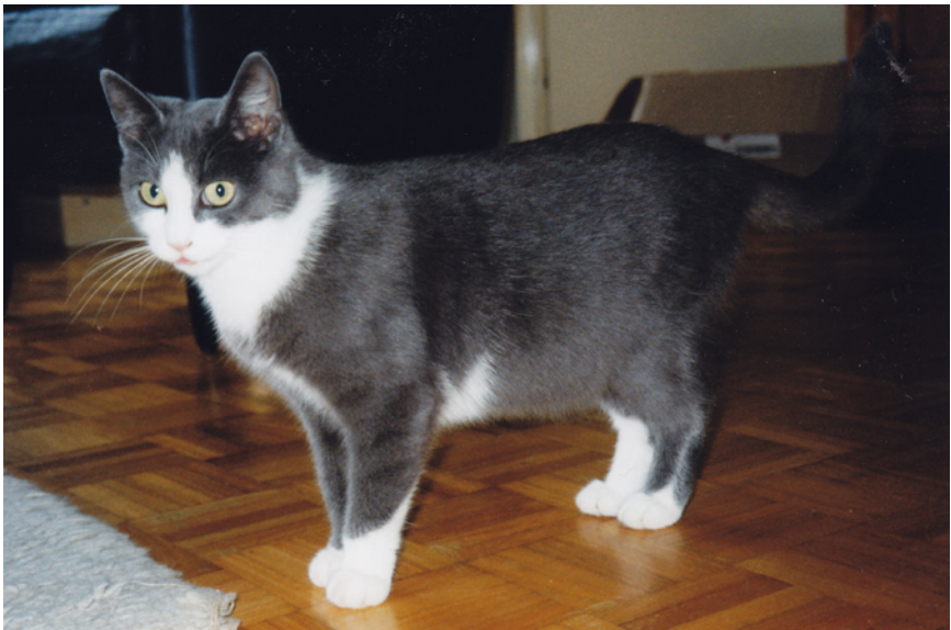
Zwanger van drie!

De komende twee weken heb ik me een slag in de rondte gezocht naar bevallingsboeken. Moeilijk aan te komen. En wat ik aan complicaties en tips, adviezen en waar op te letten, vond, dronk ik in. Een kratje zette ik klaar. Met kranten en zachte doeken. Extra aaitjes en knuffeltjes. En het liedje uit mijn kindertijd spookte met blijdschap door mijn hoofd: Poes, poes, lelijke poes, wist je dan niet dat je jongen moest? Zowaar mocht ik haar bolle buikje heel vaak aaien. Scheen haar gerust te stellen.