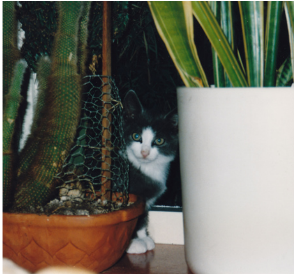
Krabben in de plantenaarde gaat niet lukken, hoe lief je ook kijkt Lotje

Schoonmama is 's avonds meegegaan op pad, met de kattenmand in de aanslag. Onze vrienden gaven haar mee en haar naam werd Lotte. Uiteindelijk was ze in ons huis door het lot dat onze kater Jopie droevigerwijs de benen had genomen. Ze vond het maar niks bij ons. Verstopte zich in een hoekje en sprong op de stoel onder de eettafel om de boel maar