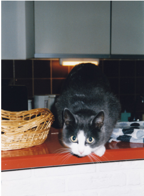
Lot springt eruit.

Schiette schatte meisje, Jij bent mijn treisje, Jij bent mijn kat, Een echte schat!