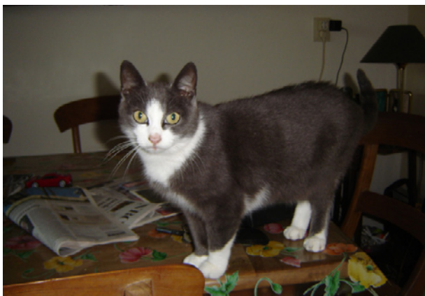
Een van de laatste foto's als fotomodel.

Lot kreeg wel extra angsten. Natuurlijk voor de stofzuiger zoals veel katten. Maar ook als de oven gebruikt was en koel blies en van de luchtreiniger moest ze ook niets hebben. Gebiologeerd ging ze dan op afstand zitten kijken of er niet - heel toevallig - een grote dikke blazende kater uit te voorschijn zou komen. Weigerend haar eten aan te raken. De enige mogelijkheid haar te laten eten was dan het bakje te verplaatsen. Zelfs een ingeschakelde kattenfluisteraar kreeg deze angst niet uit haar.