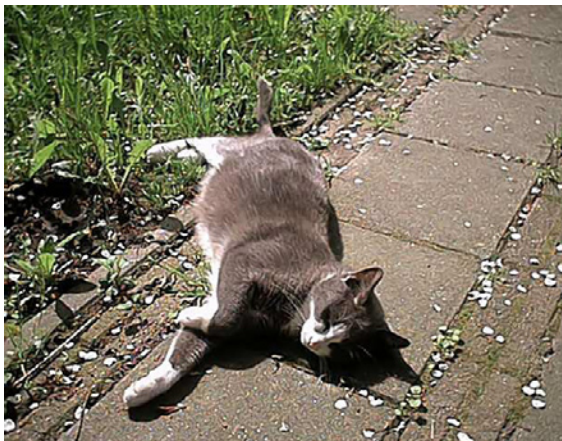
En weer zwanger.

Om met een reuzensprong naar haar achtste levensjaar te gaan: ze mocht weer zwanger worden van ons. Haar laatste nestje. Eega zeurde al jaren om een vierde kat. Dus weer stoppen met Lot's kattenpil mocht op zijn verjaardag. Zo leuk om te zien hoe langzaam katers rond haar liepen te sjansen en zij nuffig bleef tot het tijd was en ze haar keuze had bepaald. Alles speelde zich af in onze achtertuin. Hoe ik zag dat haar buikje zwol in de komende negen weken. Al zagen anderen het niet echt duidelijk, ik wel, kende mijn pappenheimer door en door. De laatste keer een kratje inrichten als kraammand en heuls veuls haar bollende buikje aaien.