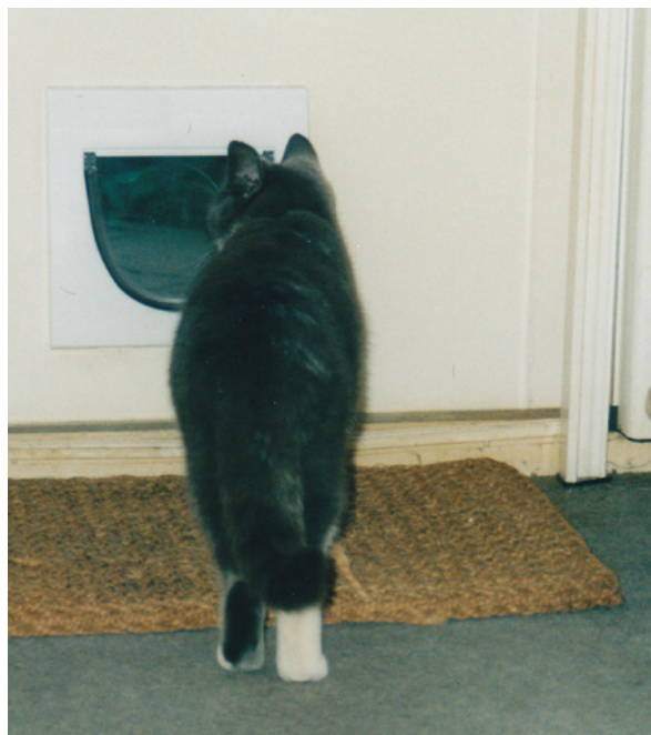
Op weg naar buiten.

Over leeuwijn gesproken heeft ze het ook een keer voor elkaar gekregen met kattenluik en al in de tuin te zitten. Ze had, waarvoor weet ik niet meer, lang doorgebracht bij de dierenarts in een hokje. En mocht niet naar buiten voorlopig, om haar narcose uit te laten werken. Buiten scholen teveel gevaren waar ze alert op moest kunnen reageren. Kattenluikje op slot gedraaid en mevrouw mocht versuft uit haar mandje in onze huiskamer. Woest was ze, woest. Merkte dat het luikje was gesloten, nam een aanloop, kop naar beneden en ram door het luikje. Middenin de tuin kwam ze tot rust met een brok luik om haar heen. Erachteraan hollen heeft in zo'n geval geen zin. Dus de deur open gezet en haar, hevig de buitenlucht snuivend, echt met roze neusje in de lucht, laten bijkomen. Na een uurtje kwam ze weer rustig in de kamer. Waar we natuurlijk elk spoor van reismanden fluks hadden verwijderd.