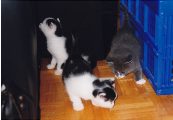
Voor het eerst buiten de kraammand gezet, valt er veel te ontdekken.

Minet kwam regelmatig bij het kratje even blazen om haar ongenoegen te uiten. Mara leek er niet veel belangstelling voor te hebben. Maar wij raakten niet uitgesproken over elke kleine vordering in de weken erna. Met